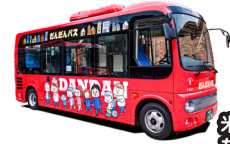
米子市 たんたんバス