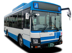
日ノ丸自動車バス